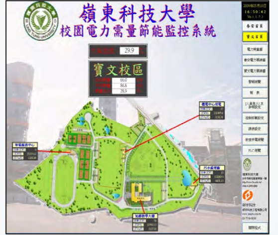
校園電力監控系統